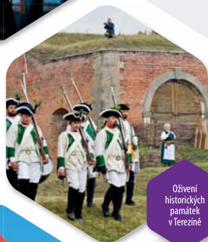
Oživení historických památek v Terezíně

Další informace o Integrovaném operačním programu: