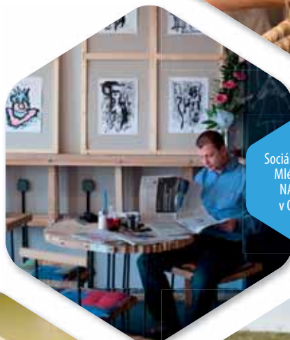
Sociální podnik Mléčný bar NAPROTI v Ostravě