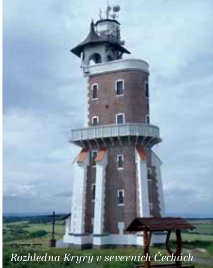
Rozhledna Kryry v severních Čechách