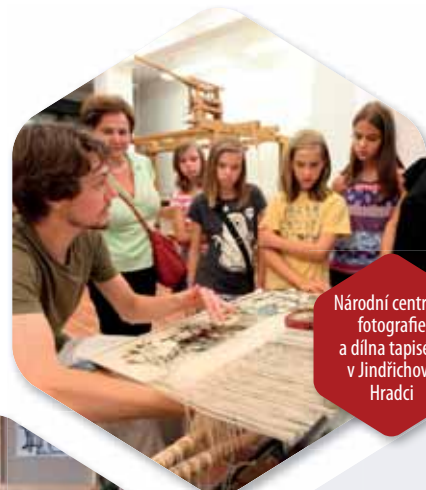
Národní centrum fotografie a dílna tapisérií v Jindřichově Hradci

Reportáže budou doplněny také o soutěže a pozorní posluchači se tak mohou těšit na atraktivní ceny .