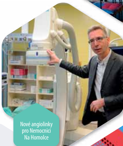
Nové angiolinky pro Nemocnici Na Homolce