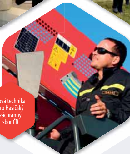
Nová technika pro Hasičský záchranný sbor ČR